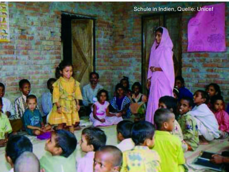
Schule in Indien

Der faire Handel macht den Einsatz von Kinderarbeitern überflüssig.