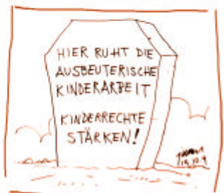
Zeichnung: Juan Acevedo