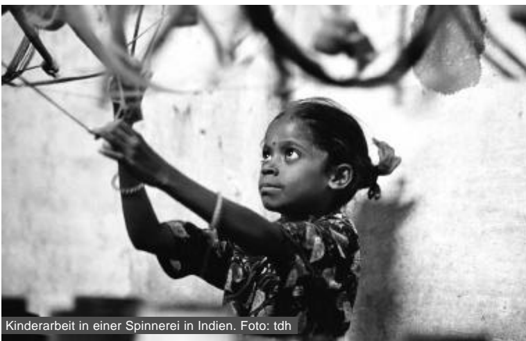
Kinderarbeit in einer Spinnerei in Indien.