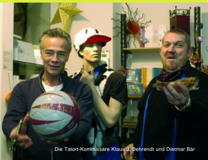
Die Tatort-Kommissare Klaus J. Behrendt und Dietmar Bär