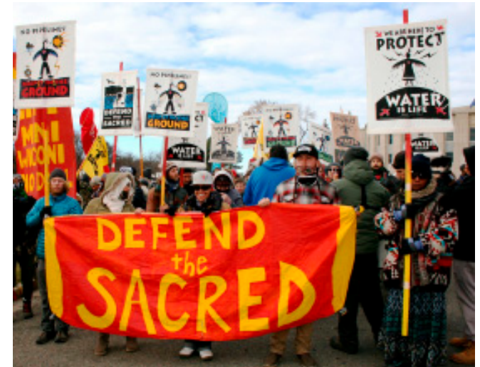
Protest in Standing Rock